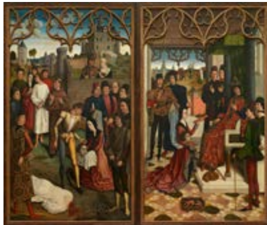
Par Dirk Bouts (Haarlem ca.1410 (?) - Leuven 1475) (Creator; Details of artist on Google Art Project) [[Public domain]], via Wikimedia Commons