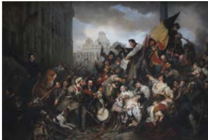
Egde Charles-Gustave Wappers