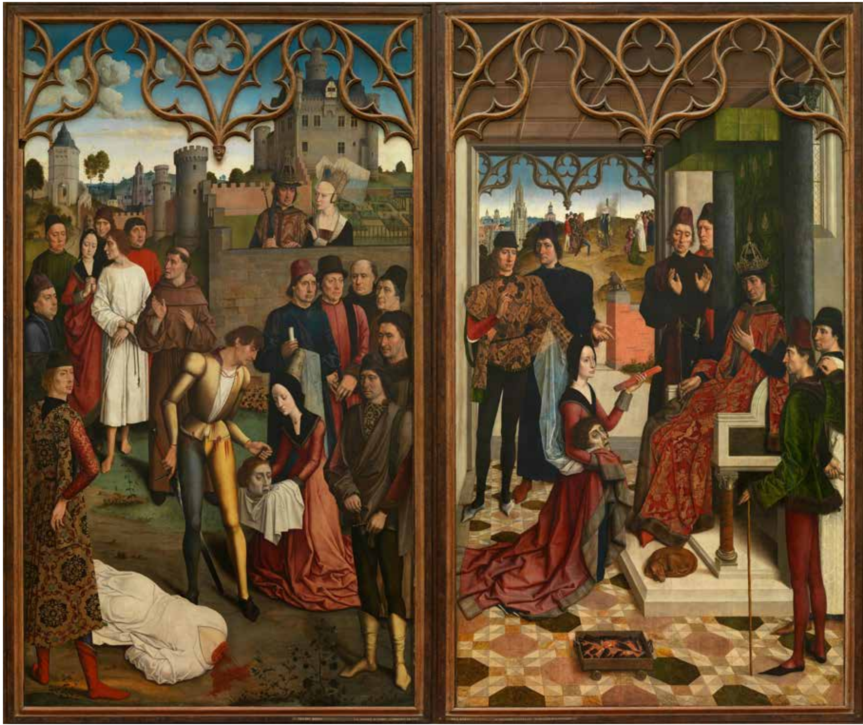
Par Dirck Bouts (Haarlem ca.1410 (?) - Leuven 1475) (Creator, Details of artist on Google Art Project) [Public domain], via Wikimedia Commons