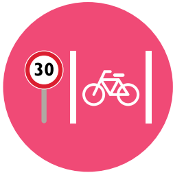
Voiries et mobilité