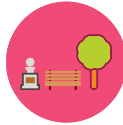
Environnement et gestion du patrimoine