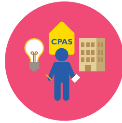
Affaires sociales et emploi