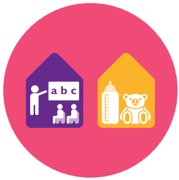
Enseignement, enfance, jeunesse et famille