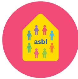
Associatif et cohésion sociale