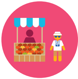
Développement économique et tourisme