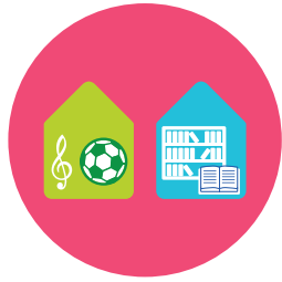
Culture et sport