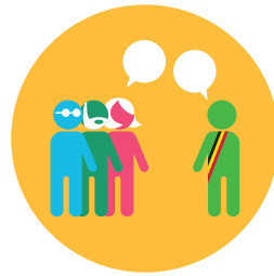
Participation et démocratie locale