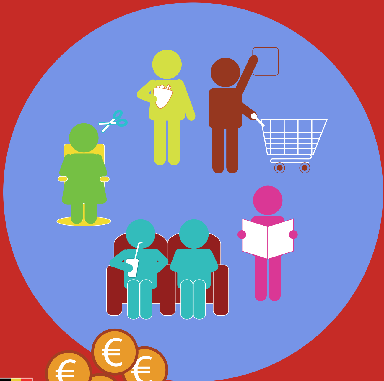
LES IMPÔTS INDIRECTS