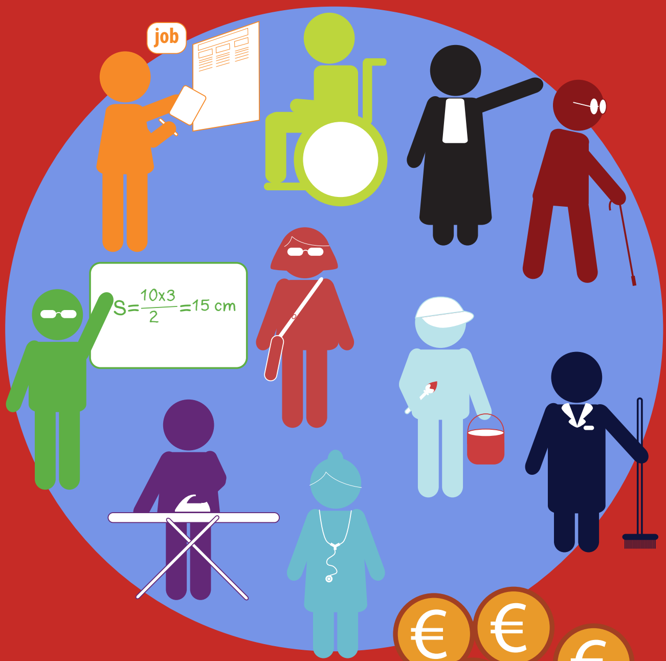
LES IMPÔTS DIRECTS